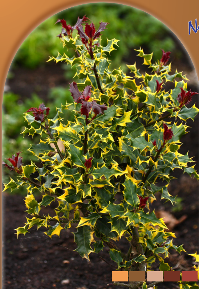
Ilex aquifolium 'Red Tips'

Red Tips is een speciaal geselecteerde Ilex aquifolium . Daardoor heeft 'Red Tips' bijzonder goede vertakking, goede groei en mooie rode uitlopers. De rode uitlopers in combinatie met de geel bonte bladeren is een uniek kenmerk dat telkens weer tot uitdrukking komt als de plant nieuwe uitlopers maakt (3 à 4 x per jaar). Daarnaast geeft de donkergroene basiskleur van het blad een scherp contrast met de goudgele rand die het hele jaar door zichtbaar is. 'Red Tips' is opvallend eenvoudig te vermeerderen door middel van stekken. De winterhardheid van 'Red Tips' is tot nog toe steeds goed gebleken.