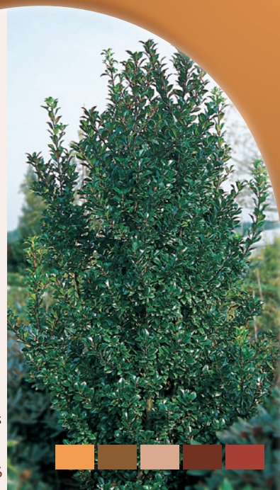
Ilex meserveae 'Heckenstar'