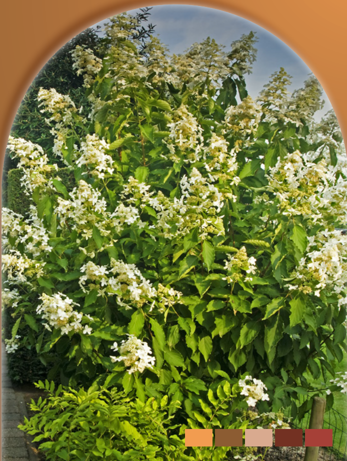
Hydrangea paniculata 'Levana'

K enmerkend voor Hydrangea paniculata 'Levana' zijn de enorme grote bloempluimen die tot wel 50cm lang kunnen worden. De zuiver witte bloemen met een doorsnede van zo'n 5 cm staan op opmerkelijk lange, stevige stelen tot wel 2 meter lang. De bloemen van 'Levana' bestaan uit vier of vijf goed gescheiden kelkbladeren die in juli en augustus als sterren om de pluim lijken te zweven. De grote massa geurende witte bloemen trekt veel insecten aan. 'Levana' is een zeer gezonde plant die geen last van ziektes heeft. Hij houdt van een zonnige standplaats en kan als solitaire plant, maar ook in groepen aangeplant worden. De bloemen zijn ook zeer geschikt als snijbloem.