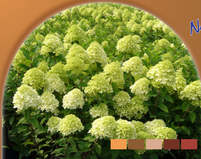
Hydrangea paniculata 'Limelight'

D e Hydrangea paniculata 'Limelight' bloeit vanaf de tweede helft van de zomer tot in de herfst met roomwitte tot limoenkleurige bloemen. De volle bloemen staan op stevige takken die ook na een regenbui niet omvallen. 'Limelight' bloeit op eenjarig hout en is een volledig winterharde zorgeloze plant. Jaarlijks stevig terugsnoeien versterkt de bloei.